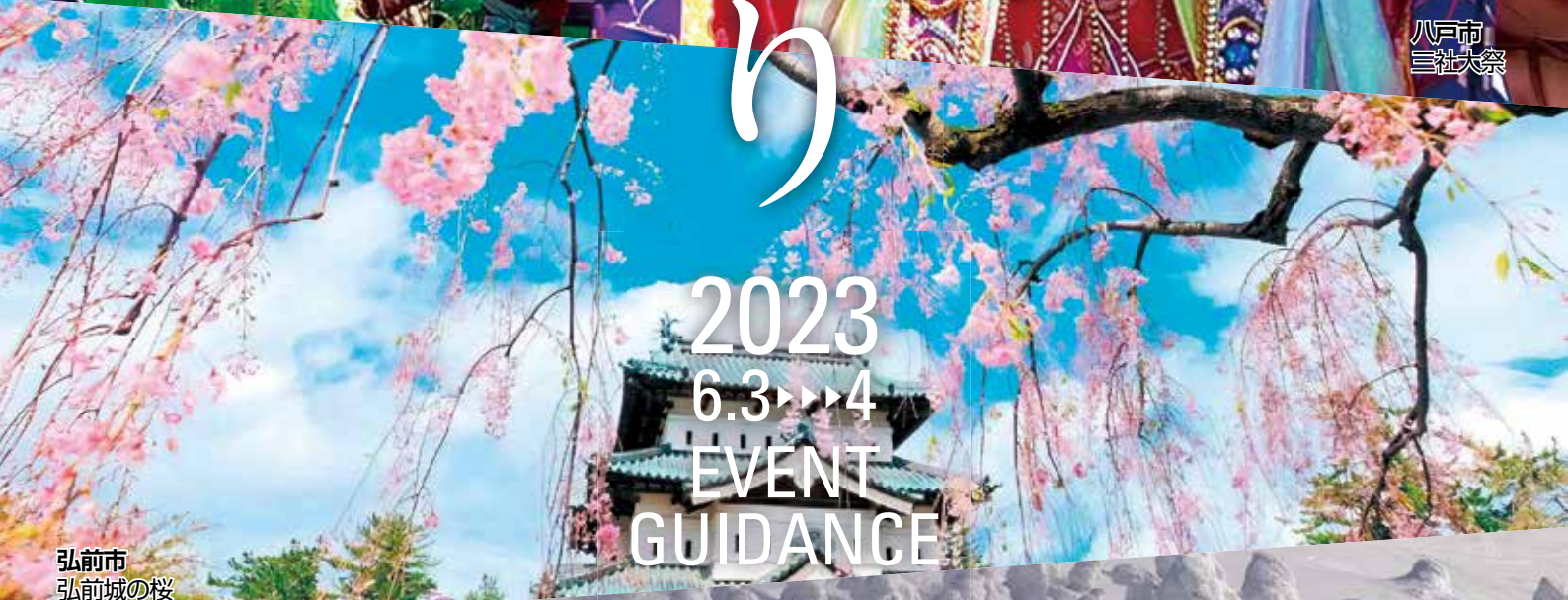
弘前市 弘前城の桜